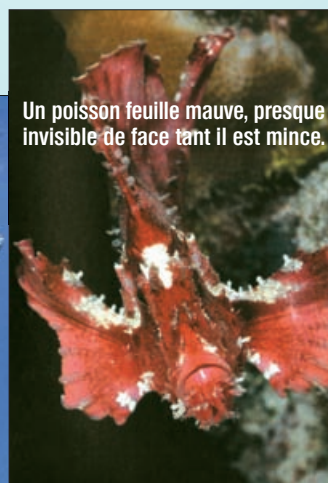
Un poisson feuille mauve, presque invisible de face tant il est mince.