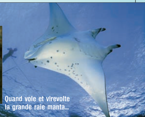
Quand vole et virevolte la grande raie manta...