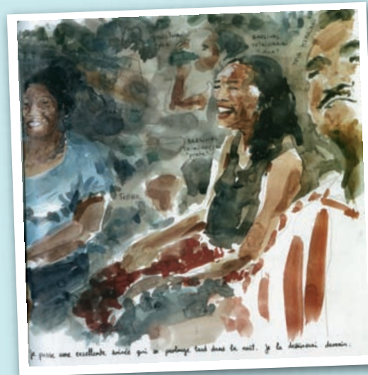
Pas de photo posée dans cet ouvrage, des "polaroids faits main"