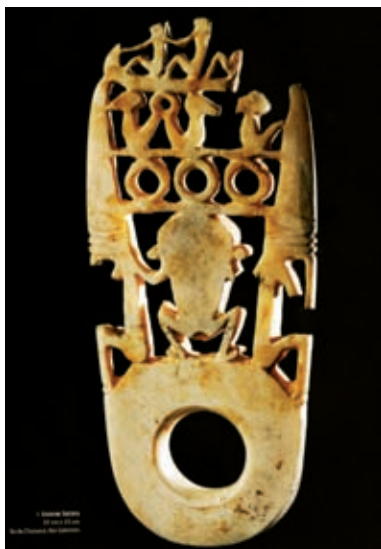
Un anneau barava (32 x 15 cm) de l'île de Choiseul (Salomon).