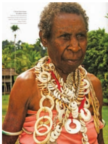
Le trésor d'une femme des plaines Turub, dans la région de Boiken (Papouasie Nouvelle-Guinée).

ouvrage époustoufflant de beauté et de savoir. De "savoirs" au pluriel faut-il écrire, tant le travail de récolte de la tradition et des informations a été au moins aussi difficile et long que celui de la simple collecte d'objets.